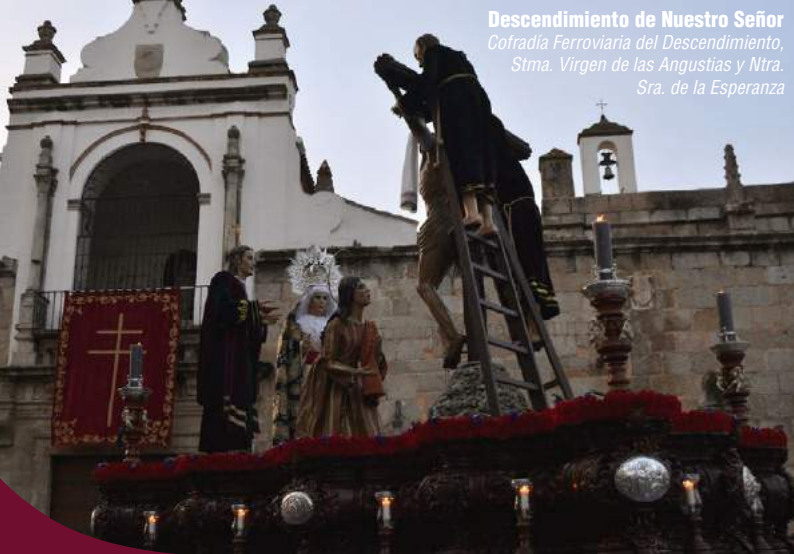
Descendimiento de Nuestro Señor Cofradía Ferroviaria del Descendimiento, Stma. Virgen de las Angustias y Ntra. Sra. de la Esperanza